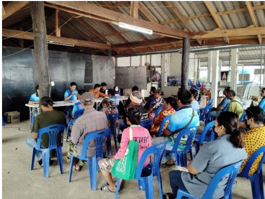
หมู่ที่ ๔ บ้านทุ่งมะเขือย้อย วันที่ ๑๖ กุมภาพันธ์ ๒๕๖๗